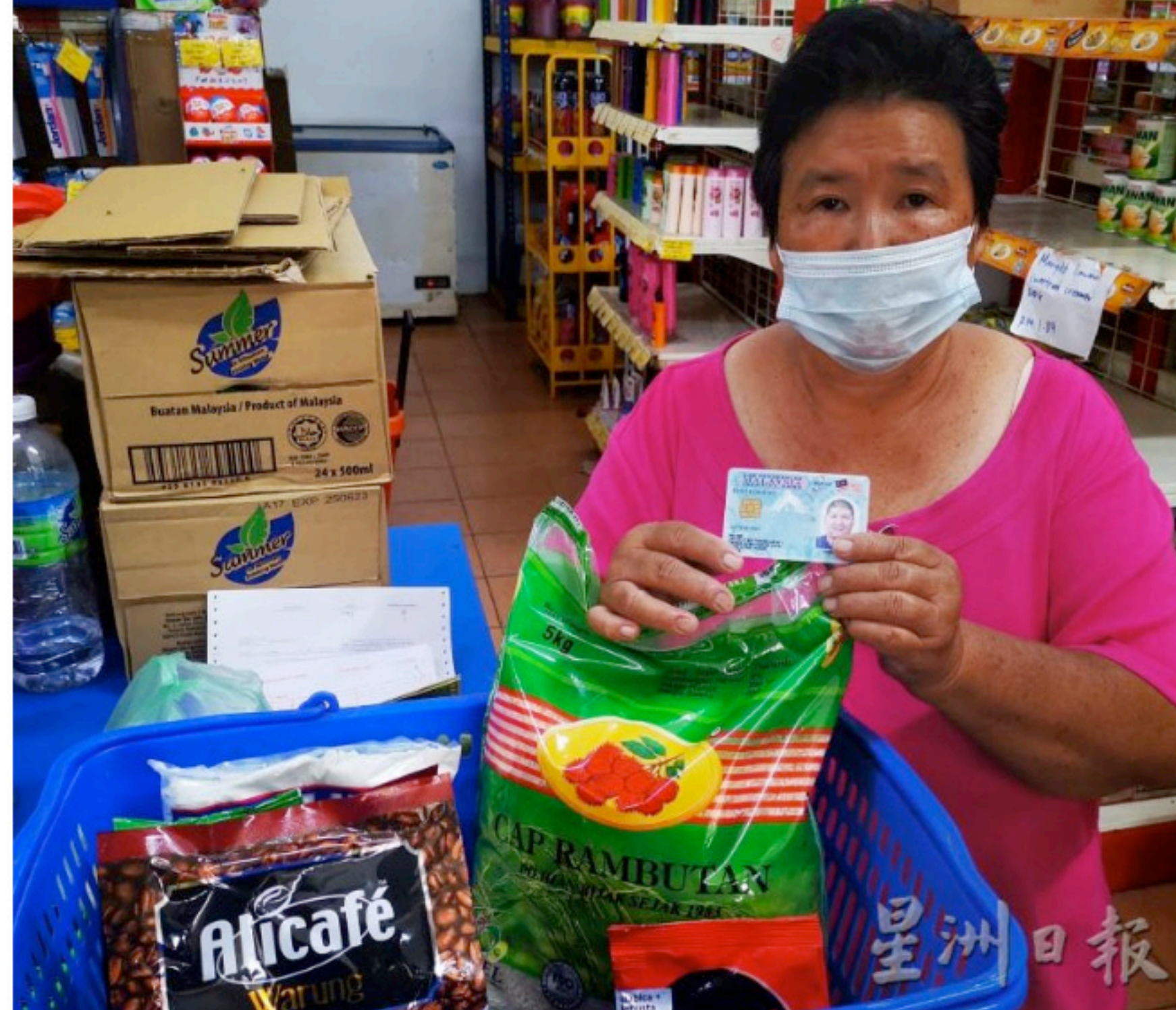
余女士展示使用儿子的大马卡, 成功买到食品。

“我的儿子有获得社会福利局的援助金, 因此我相信就是这个原因, 当局才会有儿子的资料, 并自动让儿子成为受惠者。无论如何都要感谢政府的这项援助, 多多少少都帮助减轻了家庭的生活负担。”