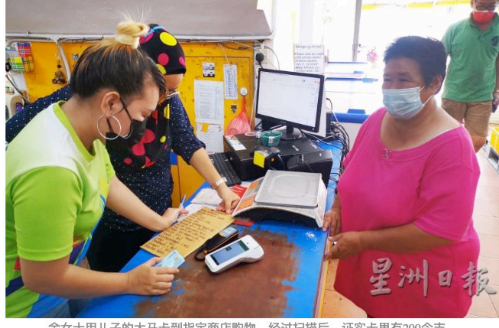
余女士用儿子的大马卡到指定商店购物, 经过扫描后, 证实卡里有200令吉。 报道: 陈世传

(实兆远2日讯) 在经济与人民强化配套 (PEMERKASA) 计划下, 政府拨款1亿令吉让全马30万名贫困人口透过使用大马卡, 以无现金方式到指定商店购买基本食品的援助计划, 已在霹靂州一些地区包括曼绒县开跑。