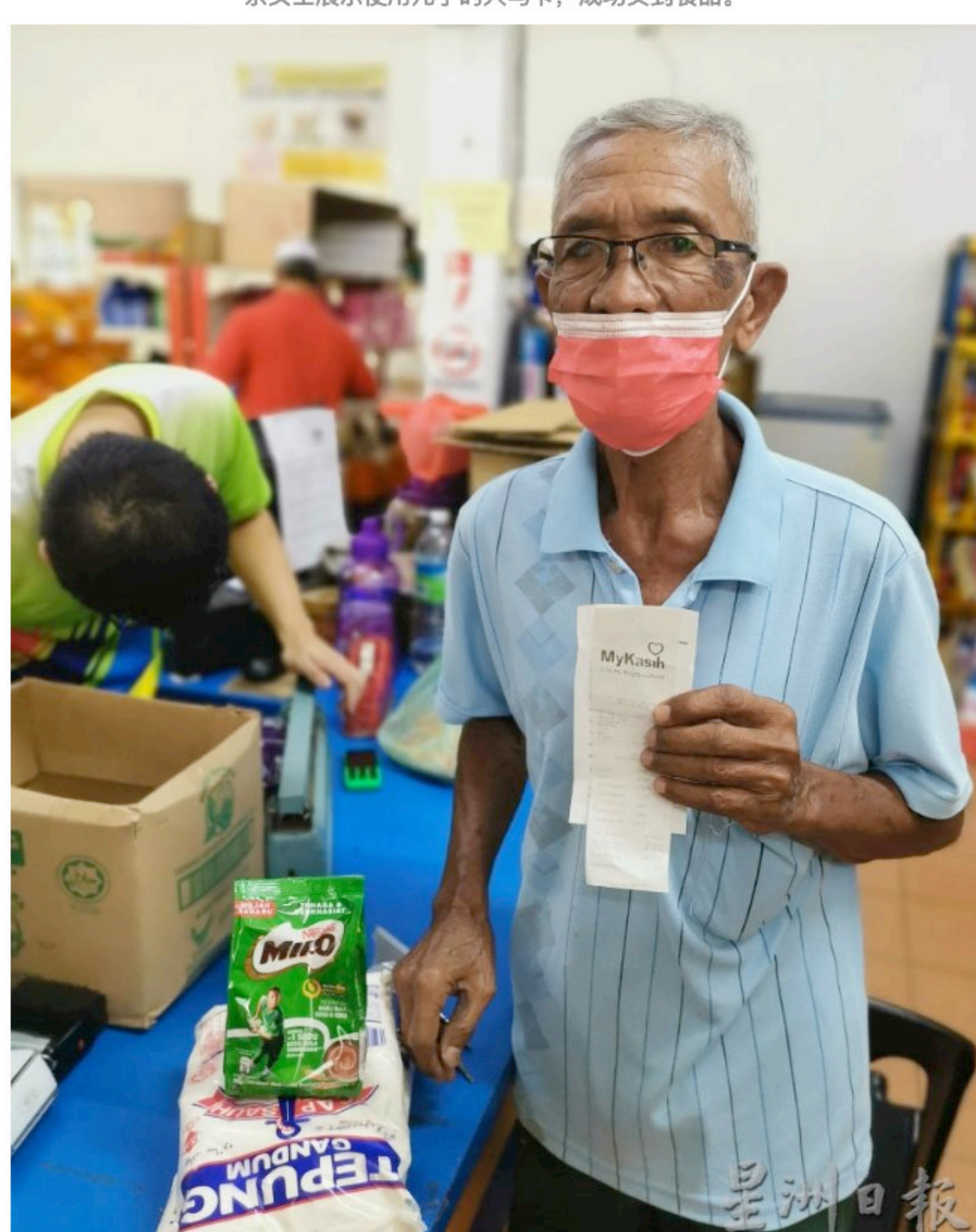
这名来自爱大华的巫翁大叔说, 他已是第二次用大马卡来买食品了。